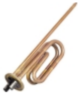
Запчасти для бойлера