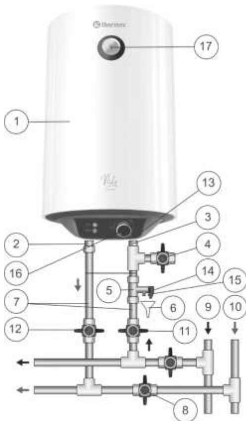
Рисунок 1. Схема підключення ЄВН до водопроводу

При монтажі не допускається прикладення надмірних зусиль, щоб уникнути пошкодження різьби патрубків.