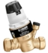
Редукторы давления воды